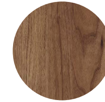
Teakholz . geölt teak wood . oiled