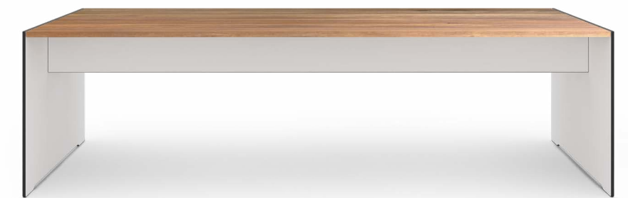
RIVA wood . bench H 43 . B 245 . T 43 cm