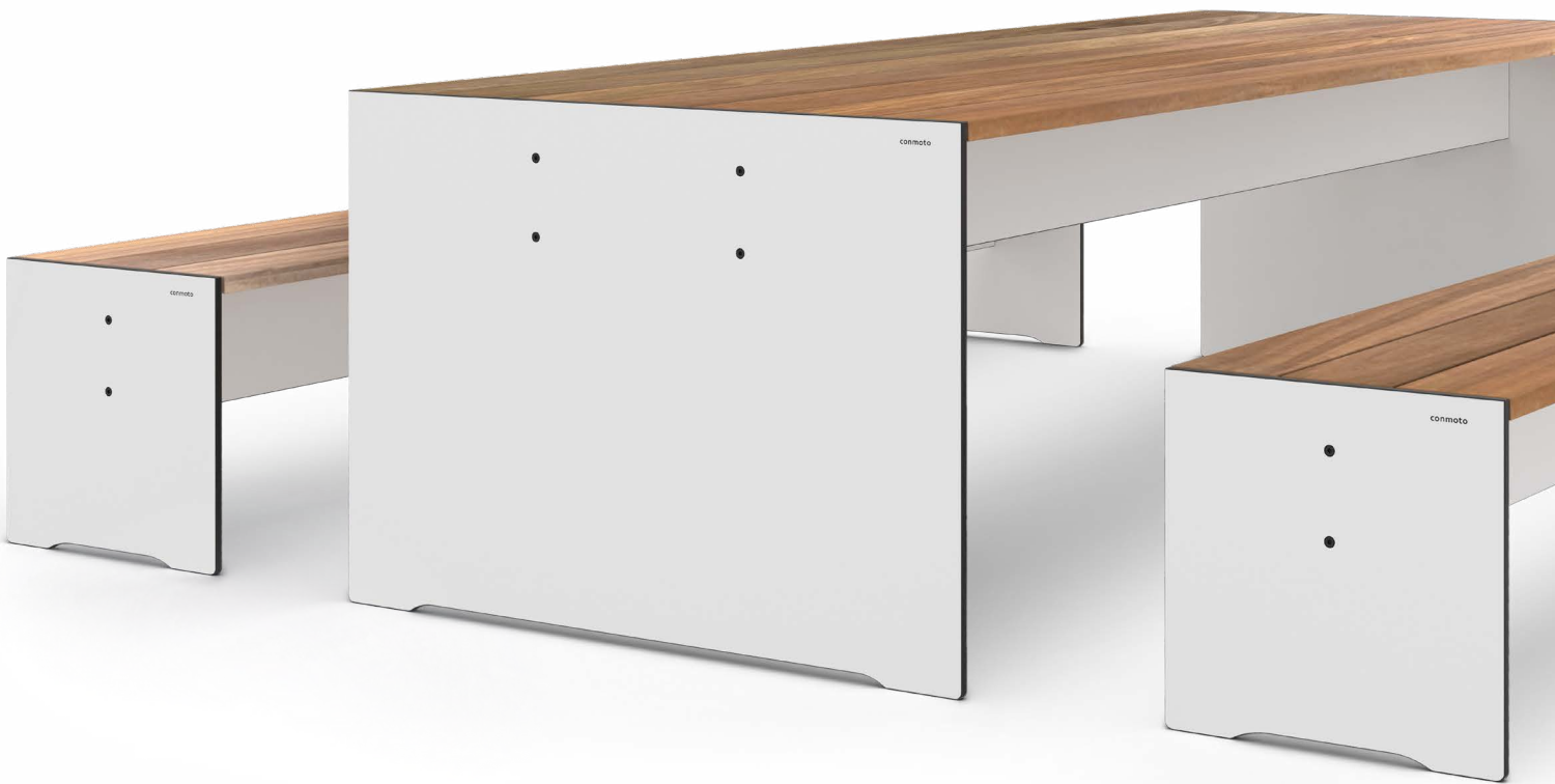
table & bench