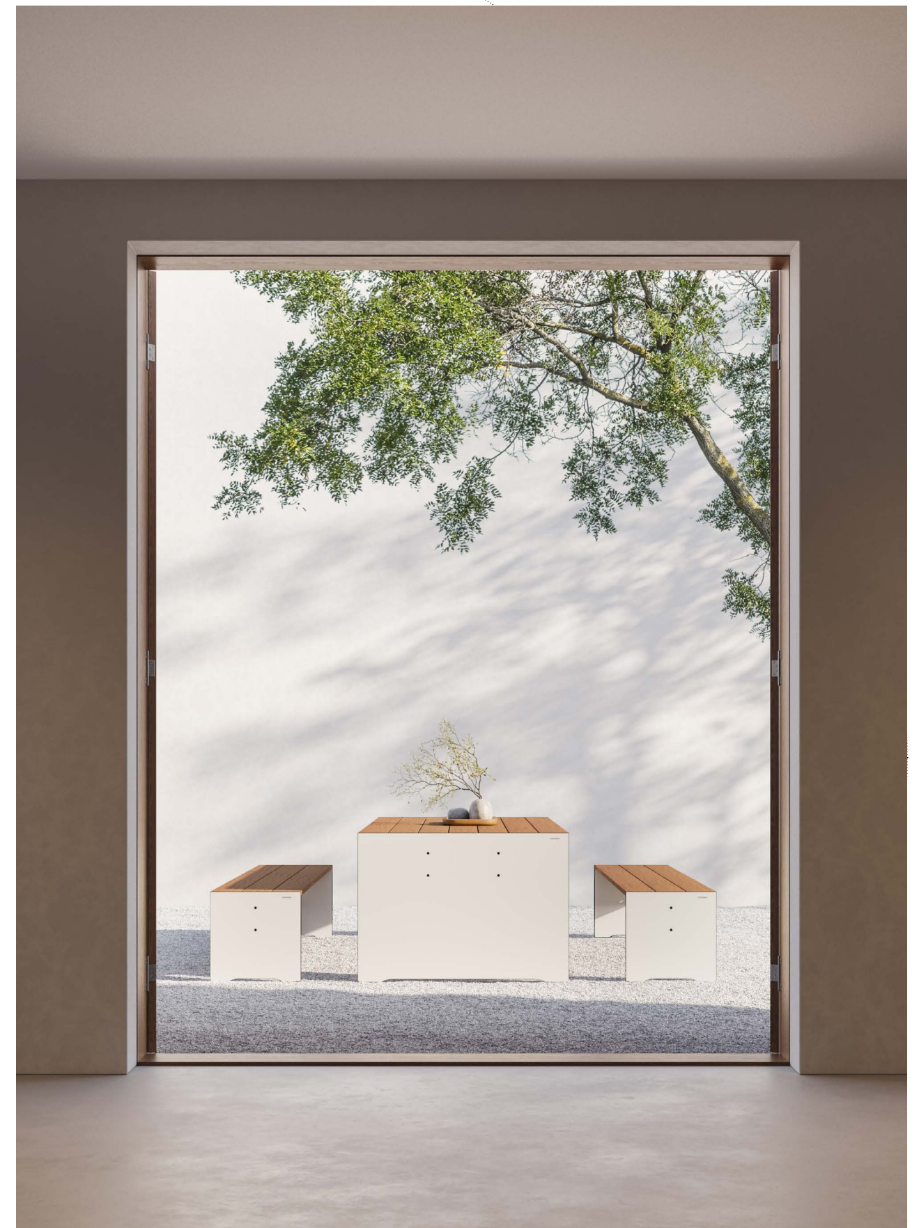
Riva wood Kombination in weiß mit einem Tisch und zwei Bänken. Riva wood combination white with one table and two benches.

Functionality meets naturalness, minimalism meets exclusivity. The warm and inviting teak slats create a cozy atmosphere, but are just as robust and suitable for outdoor use as the HPL material.