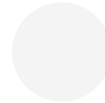
HPL . weiß white