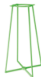
Spalvieri & Del Ciotto